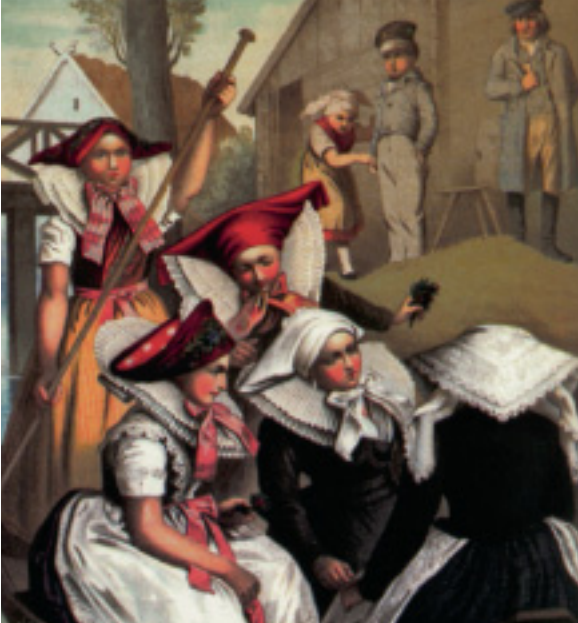
Albert Kretschmer: Kahnfahrt zur Hochzeit, Chromolithografie, Ende 19. Jh., Preußen-Spreewald Blatt 17, Heimatmuseum Dissen

Alltagskultur und Festtagsbräuche im Reich der Sorben