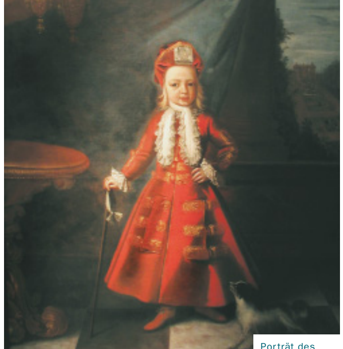
Porträt des Melchior Holle, Focke-Museum, Bremen

gen aus der Bremer Raumfahrtindustrie, bei »T« wie »Tönen« finden sich nicht nur Musikinstrumente sondern auch die Radios, Tonbandgeräte und die Pausenzeichenmaschine von Radio Bremen. Man kann also stöbern wie auf einem alten Dachboden, erhält aber auch alle Informationen über die Objekte, die durch Computerterminals und akustische Führer erschlossen werden. Und es ist sogar noch etwas Platz vorhanden für das, was die Bremerinnen und Bremer dem Focke-Museum in Zukunft noch schenken werden – unter »W« wie »Wünschen«. HEINZ-GERD HOFSCHEIN