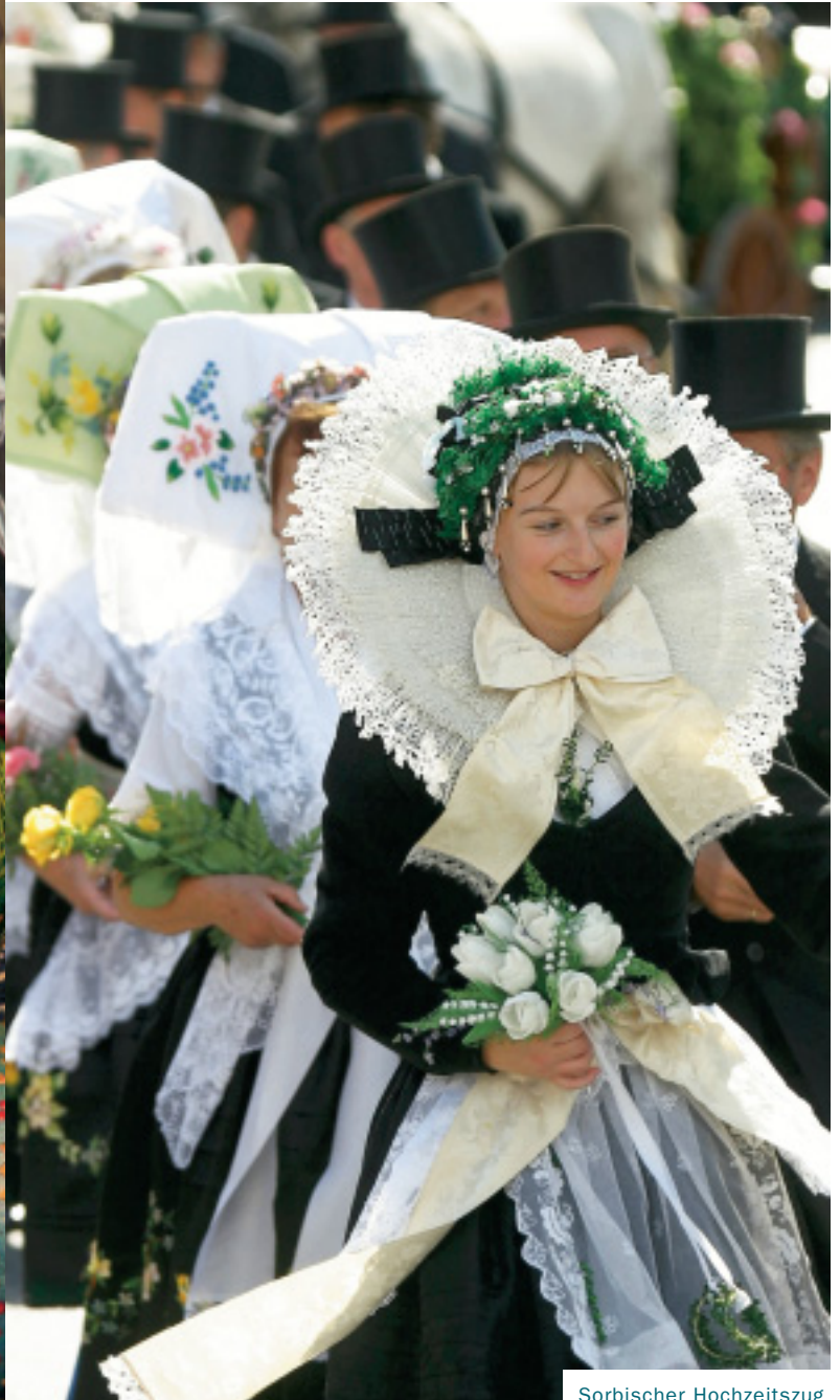
Sorbischer Hochzeitszug in Burg/Spreewald