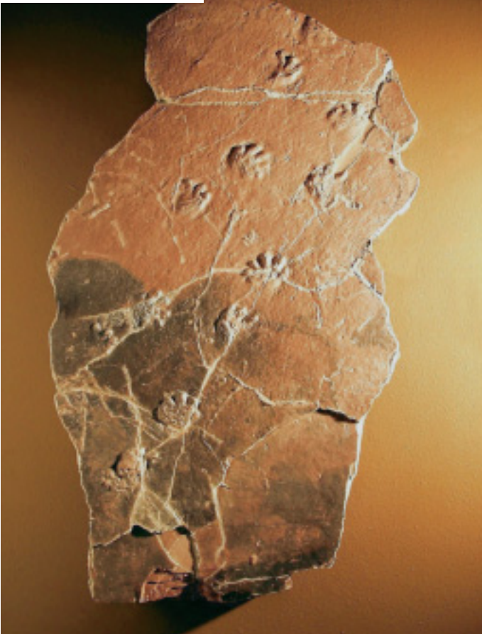
Saurierspur aus dem Rotliegenden von Nierstein