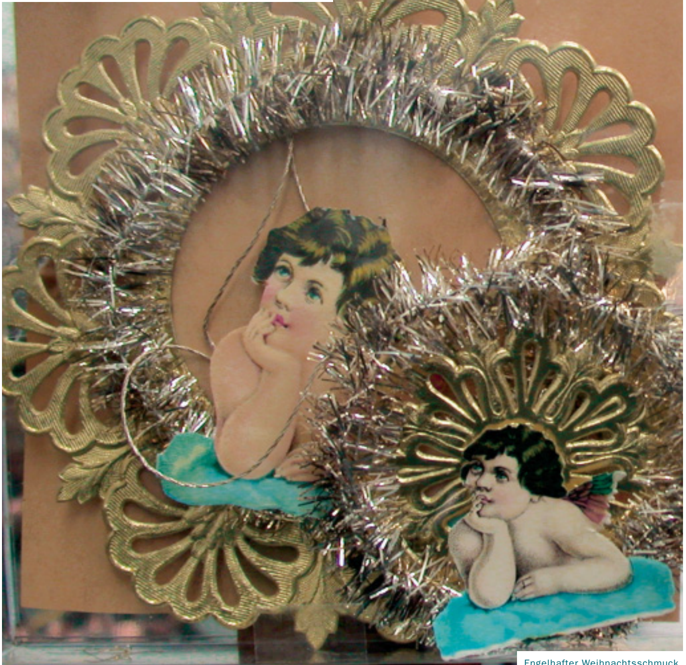
Engelhafter Weihnachtsschmuck, Foto: Wolfgang Stähler

Ein Museum im mittelfränkischen Roth erzählt die Geschichte der »Leonischen Industrie«