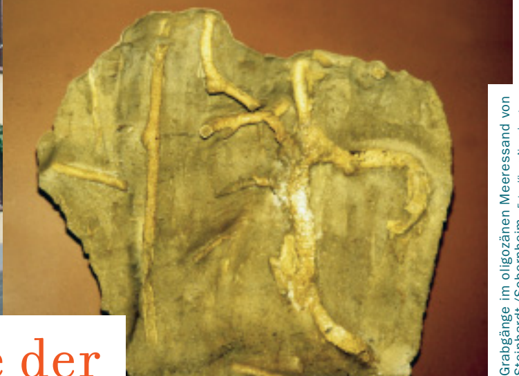
Grabgänge im oligozänen Meeressand von Steinhardt/Sobornheim, Foto: Klaus Naumburg