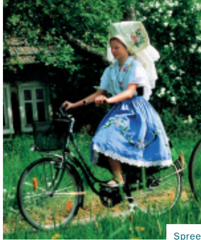
Spreewälderin auf dem Fahrrad, Foto: B. Choritz

»SIND WIR SCHON IN POLEN?« Erstaunt versucht ein Besucher die Bildunterschrift in der Museumsscheune Bloischdorf zu enträtseln. Aber nein, hier sei man immer noch in Brandenburg, versichert der Museumsmitarbeiter, nämlich im südöstlichsten Zipfel, der Niederlausitz. Hier leben bis heute Sorben und Deutsche mal mehr, mal weniger friedlich nebeneinander. Das kleinste slawische Volk, die Sorben oder Wenden, wie sie auch bezeichnet werden, sind Nachfahren jener slawischen Stämme, die im Zuge der Völkerwanderung vor mehr als 1400 Jahren das Land zwischen Oder und Elbe, zwischen Ostsee und den deutschen Mittelgebirgen besiedelten. Zu Luthers Zeiten reichte das sorbische Sprachgebiet noch bis Wittenberg. Die erste Übersetzung der Lutherbibel erfolgte 1548 ins Sorbische, obwohl der Reformator dies keineswegs für lohnenswert erachtete, da die Sprache – so Luther – in 100 Jahren sowieso ausgestorben sei. Doch die sorbische Kultur hat die Zeiten überdauert. Heute leben 60 000 Sorben in der sächsischen Ober- und der brandenburgischen Niederlausitz.