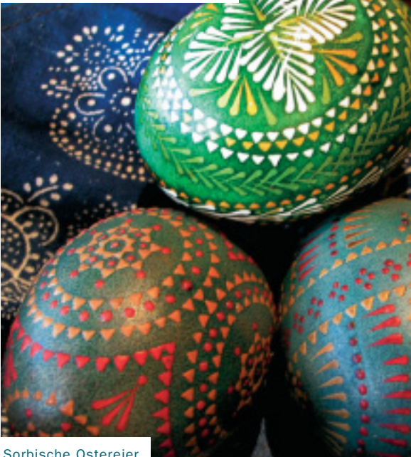
Sorbische Ostereier

NIEDERLAUSITZER SORBISCHES DORFMUSEUM BLOISCHDORF // DOLNOLUZYJSKI SERBSKI WEJSNY MUZEJ BLOBOSOJCE //