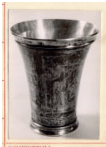
Inventarnummer 1: Silberbecher mit mittelalterlichen Szenen, um 1840. Heute verschollen.

WALTER STENDEL wird den Ankauf sein Leben lang als Rettungsaktion begreifen und rechtfertigen. Durchaus in der Tradition seines steten beruflichen Bemühens, neben künstlerisch wertvollen auch die Dinge des Alltags zu bewahren. Doch im Falle der Silbersammlung lässt ihn das zum Nutznießer der nationalsozialistischen Judenverfolgung werden. Zumindest zeitweilig, denn bei Kriegsende geht der größte Teil der Sammlung verloren. Geplündert, verbrannt, in einem Stollen in Thüringen vergraben: Gerücht und Wahrheit verschwimmen. Fakt ist, dass nur 500 kleinere und Kleinstobjekte erhalten bleiben. In den kommenden Jahrzehnten werden sie kaum beachtet werden.