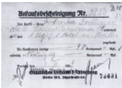
90 Mark für die Erinnerung: Ankaufbescheinigung über einen Ring und eine Brillant-Nadel, 3. März 1939.