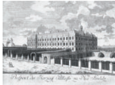
Geadelt: Die Herzöge von Mecklenburg-Strelitz kauften und präsentierten einen Großteil der Figuren.

Regionalmuseum Neubrandenburg zeigt spektakuläre Fälschungen aus dem 18. Jahrhundert