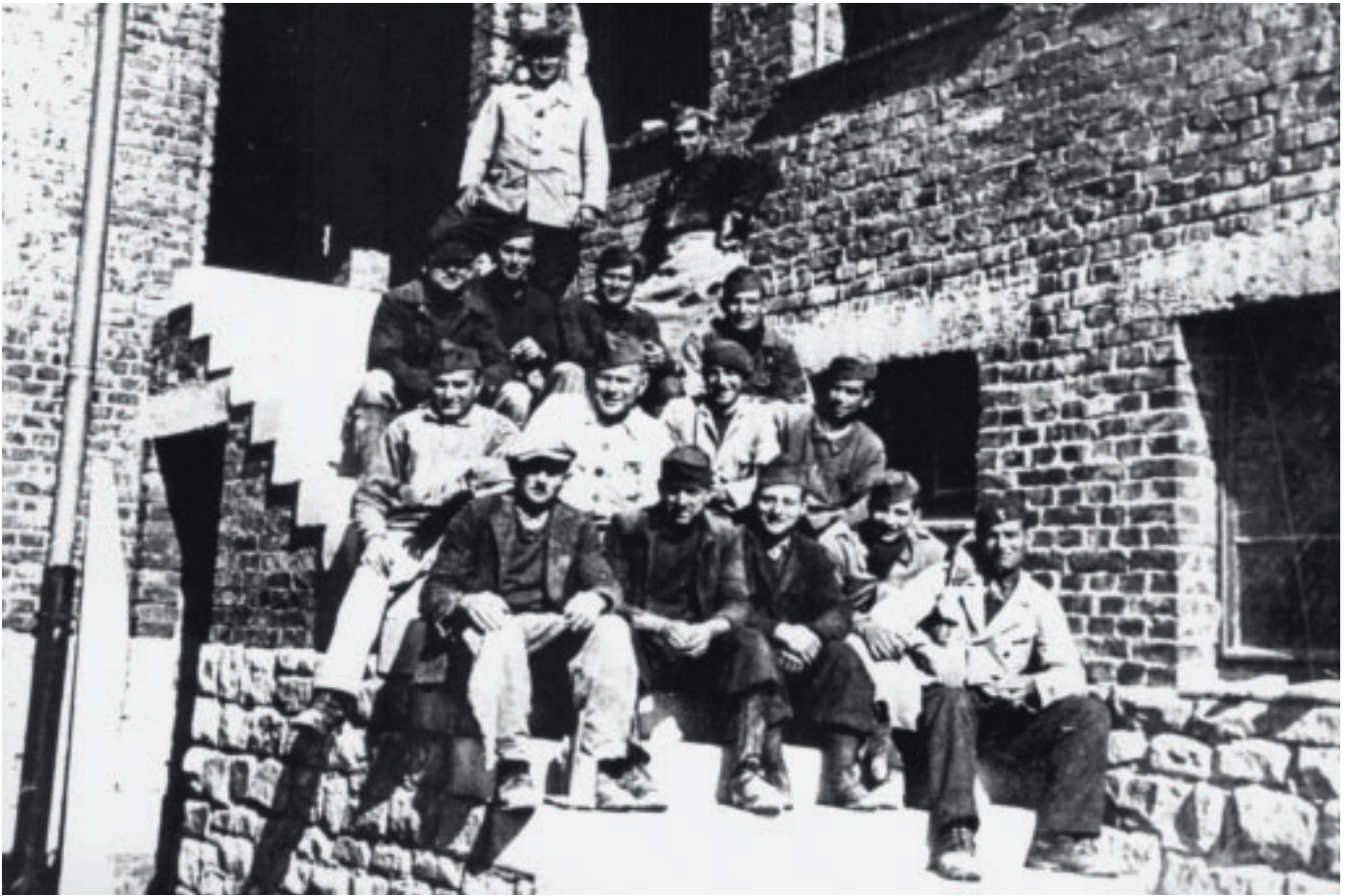
Handwerklich begabt: Diese französischen Kriegsgefangenen, unter ihnen Architekten und Künstler, mussten die Zieghainer »Kreisberufsschule« ausgestalten.