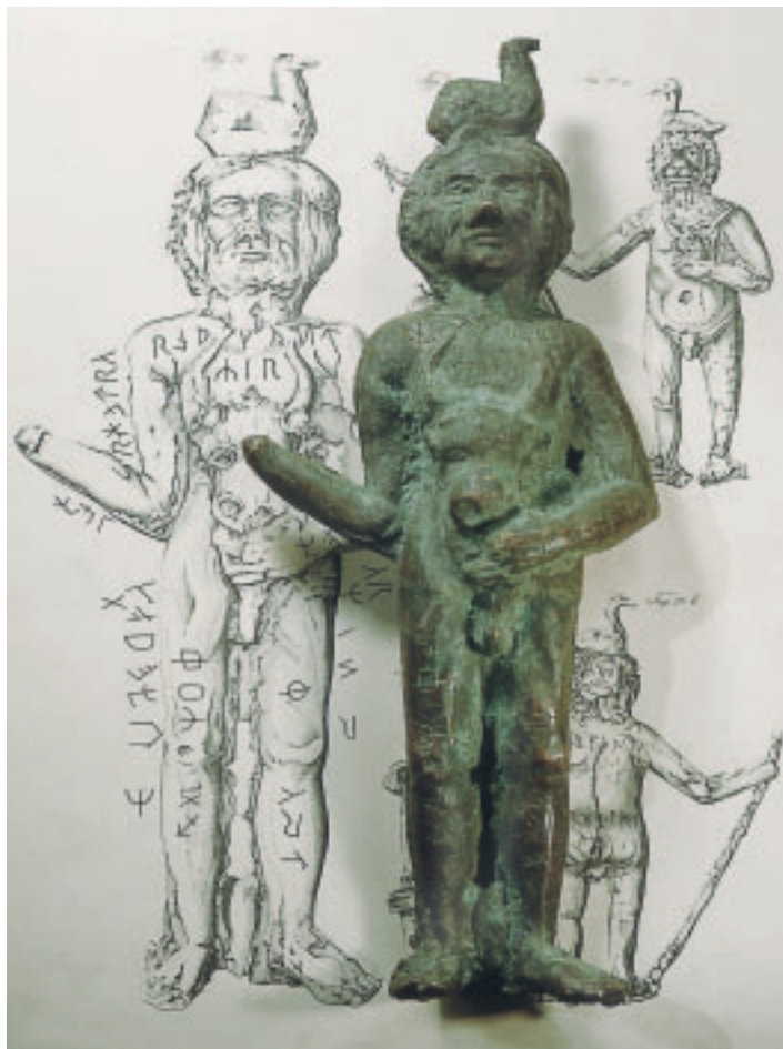
Gedruckt: Im Laufe der Jahrhunderte erschienen immer wieder wissenschaftliche Dokumentationen zu den Figuren.