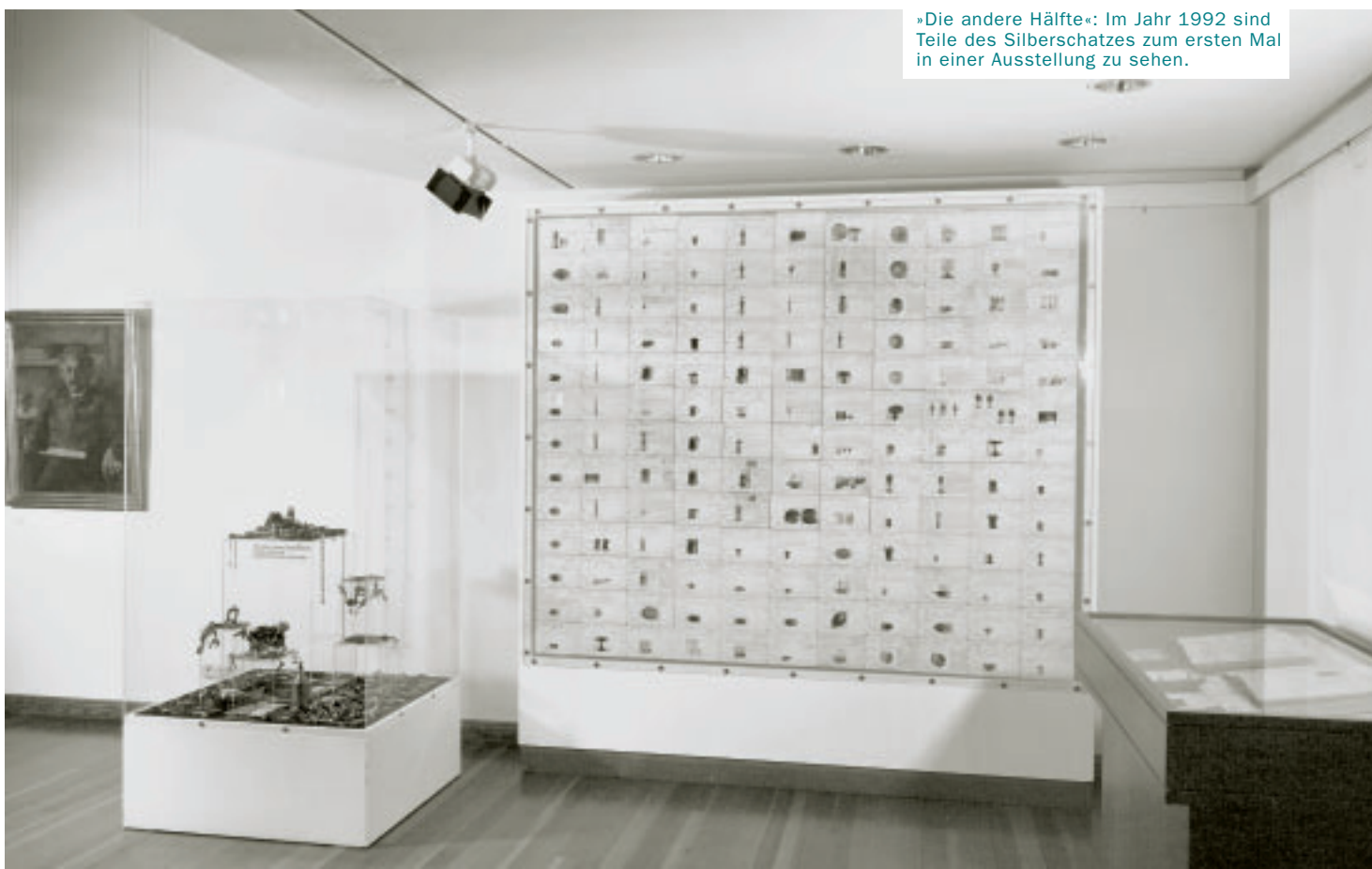
»Die andere Hälfte«: Im Jahr 1992 sind Teile des Silberschatzes zum ersten Mal in einer Ausstellung zu sehen.