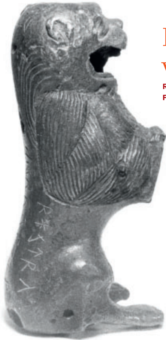
Gefunden: Löwenfigur mit eingeritzten Runen.