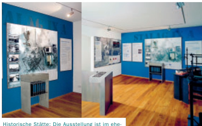
Historische Stätte: Die Ausstellung ist im ehemaligen Wachhaus des Lagers eingerichtet.