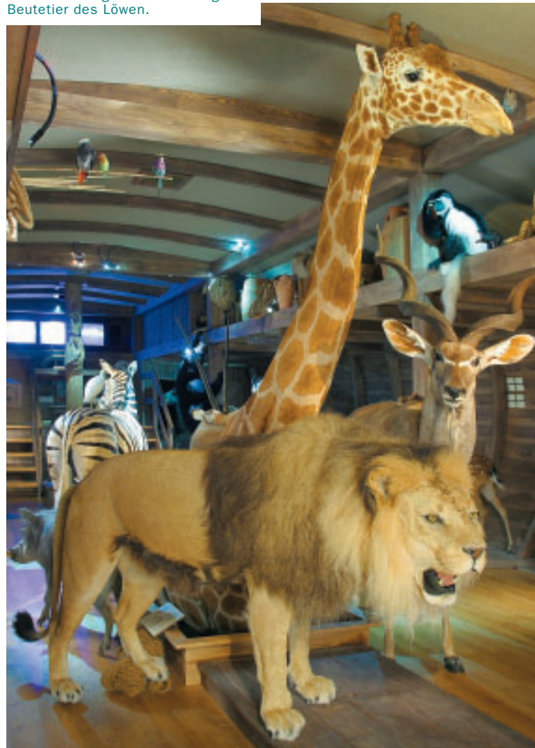
Friedliche Utopie: Die Kudu-Antilope (r.) ist in Afrika eigentlich bevorzugtes Beutetier des Löwen.