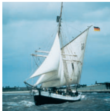
Mit Wind und Wellen: Heute vermittelt das Schiff ein Stück Segelhandwerk aus vergangenen Zeiten.

DASS MIT DER ›Grönland‹ die deutsche Polarforschung begann, war der Auslöser, warum das DSM das Schiff 1973 in der Gründungsphase des Museums kaufte. Jahrelang hatte der Gothaer Geograph Dr. August Petermann Mitte des 19. Jahrhunderts dafür geworben, dass sich Deutschland an der internationalen Polarforschung beteiligt. In Bremen und Bremerhaven fand er Gehör – im Auftrag des Bremer Komitees für Nordpolarforschung kaufte Kapitän Koldewey im Jahr 1868 für 3750 Taler die in Bergen gebaute ›Grönland‹, ließ ihren Holzrumpf mit Eisenplatten verstärken und segelte los. Am 5. September des Jahres erreichte er die höchste nördliche Breite. »Das kleine Fahrzeug ist bis zu einer anständigen Polhöhe vorgedrungen«, kommentierte Petermann die unvorstellbare Sensation knapp.