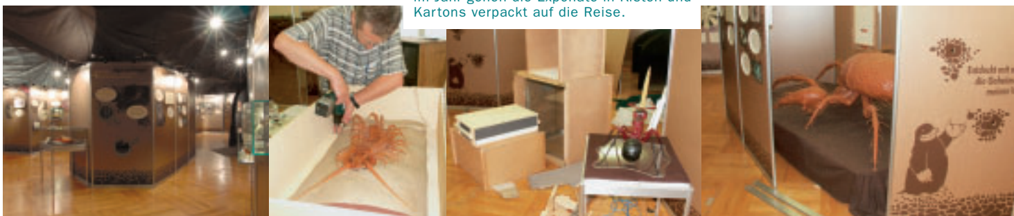
Wanderausstellung, ganz mobil: Drei Mal im Jahr gehen die Exponate in Kisten und Kartons verpackt auf die Reise.