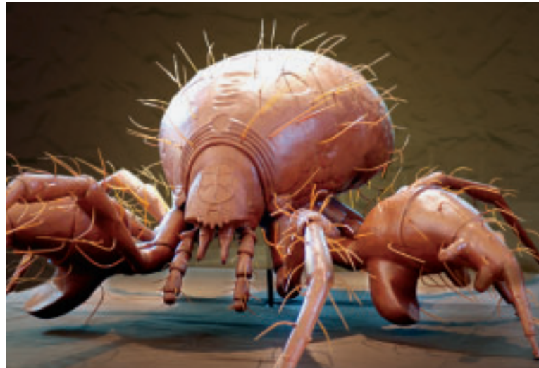
Winzling, ganz groß: Diese Raubmilbe misst in natura gerade mal einen Millimeter.