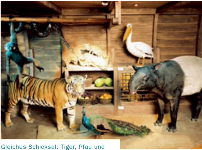
Gleiches Schicksal: Tiger, Pfau und Schabrackentapir zählen zu den gefährdeten Tieren im asiatischen Raum.

ICH HABE GLÜCK: Es ist Donnerstagnachmittag und ich kann sofort aufs Schiff. Mein Audioguide erklärt mir, warum das Wisentkalb an der Rampe eine so prominente Position bekommen hat: Es ist ein Tier mit Symbolcharakter, denn ein Zuchtexperiment rettete diese Art vor Jahren vor dem Aussterben. Anfang des 20. Jahrhunderts lebten einzig in Polen noch zwölf Exemplare. Ein Deutscher trieb sie zusammen und erhielt so ihren Bestand. Heute ist der Wisent jedoch wieder bedroht. Genau wie die Giraffe, der Löwe oder das Warzenschwein, die mich im Bauch der Arche empfangen. Sie stehen in der Mitte der Ladefläche – wie alle Tiere, die in Afrika zu Hause sind.